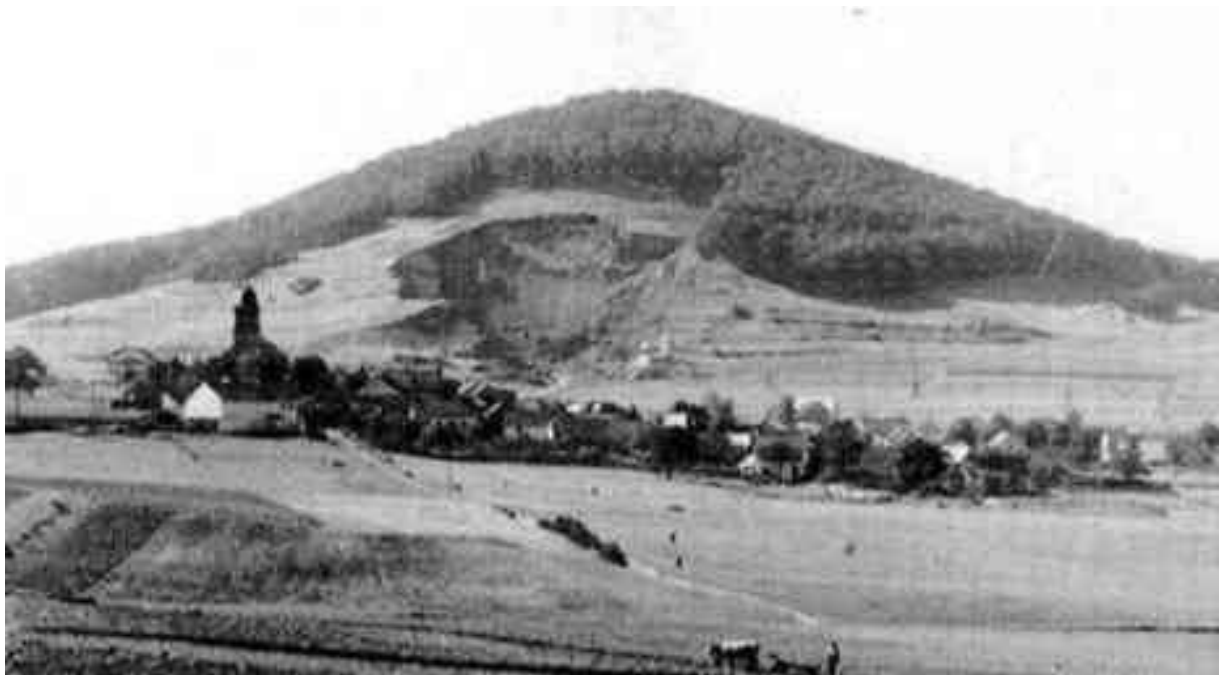
Goßberg bei Walsdorf um 1926 – Chronik Walsdorf-Zilsdorf

Die Mitglieder der Planungsgemeinschaft konnten sich bei der Rundfahrt ein eigenes Bild von dem machen, was dem Landkreis Vulkaneifel bevorstehen könnte. Dies ist in sofern von höchster Bedeutung, da die Planungsgemeinschaft in dem später folgenden Abwägungsprozess festlegen wird, in wie weit die Vorschläge des LGB umgesetzt werden. Die wenigsten Mitglieder kannten jedoch die Vulkaneifel bis dahin aus eigener Anschauung.