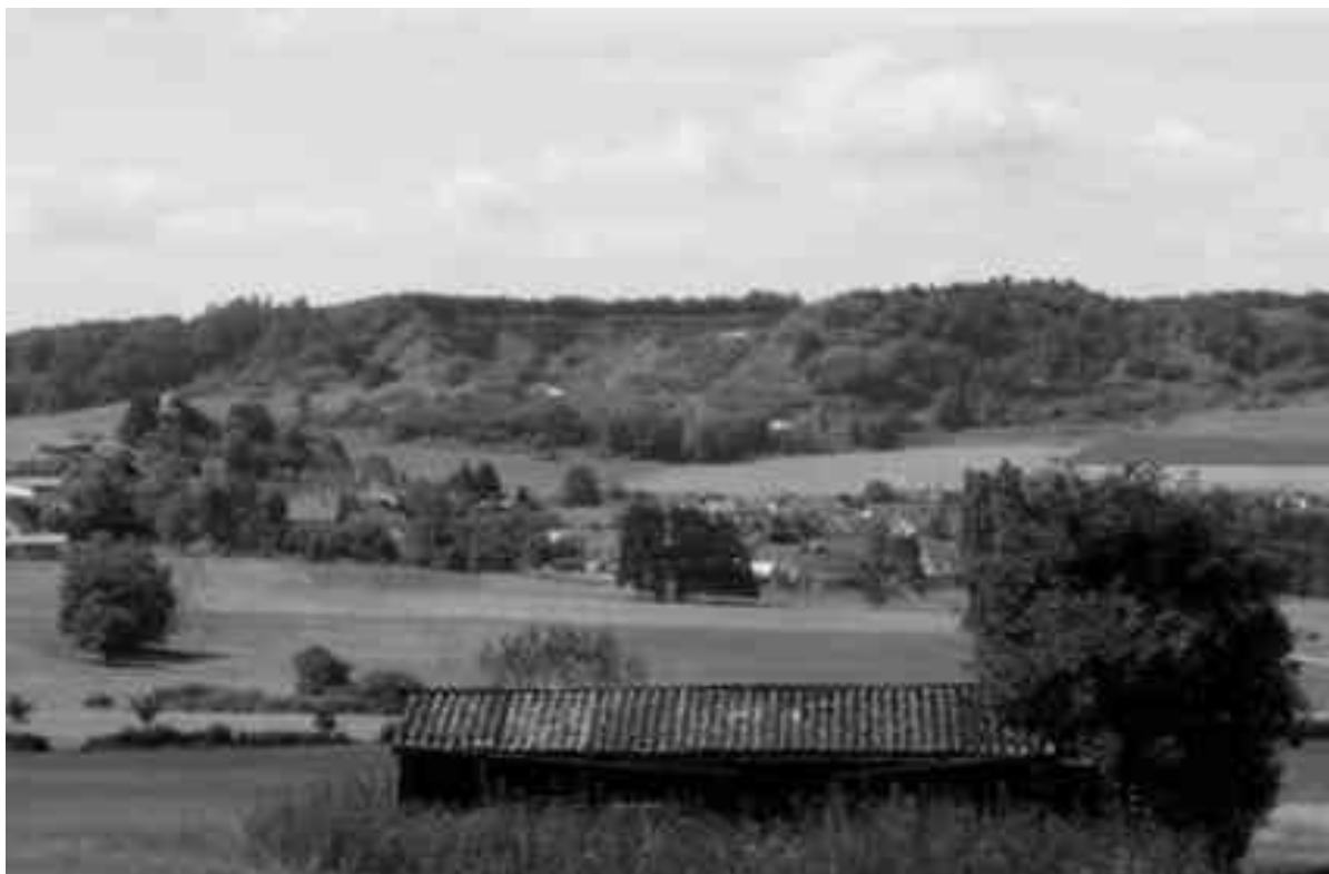
Goßberg bei Walsdorf 2007 – Foto: Erkert

Insgesamt scheint es, sind die Naturschutzverbände mit ihrer Arbeit ein gutes Stück vorangekommen. Man kann sagen, dass sie für ihr Anliegen bei allen angesprochenen Verwaltungsebenen Verständnis antrafen – das LGB verständlicherweise ausgenommen. Was die Arbeit letztendlich gebracht hat, wird der Entwurf für die Rohstoffplanung zeigen. Die Planungsgemeinschaft will ihn in diesem Jahr vorlegen.